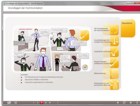
WBT-Reihe Praxiswissen „Kommunikation“ 17 WBTs