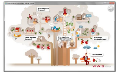
WBT-Reihe Praxiswissen eTutoring 5 WBTs