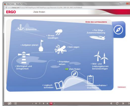
WBT-Reihe Praxiswissen Zeit- und Selbstmanagement 11 WBTs